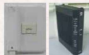
光コンセント ホームゲートウェイ

壁に光接続用のケーブルを配線のための「光コンセント」を取り付け、インターネット接続用の機器である「回線終端装置」まで配線いたします。利用可能な配管が無い場合は「露出配線」にて施工させていただきます。