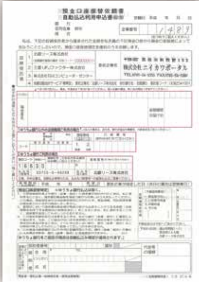
預金口座振込依頼書 自動振込利用申込書

ニーポ光、ニーポ光 ひかり電話のお支払いは「口座振替」のみのご対応となります。申込書に同封されている「預金口座振替依頼書 自動払込利用申込書」をご提出ください。